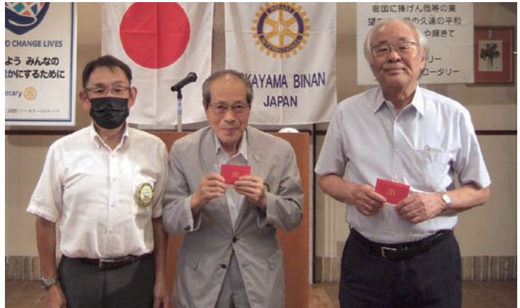
犬飼会長 本郷会員 若林会員