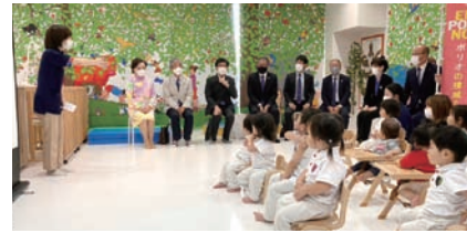
実施クラブ 岡山西南RC 岡山岡南RC 岡山備南RC