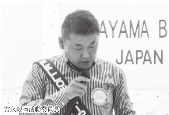
吉永親睦活動委員長

【用語便覧2008】 6月はレクリエーション活動や保健と医療問題に共通の関心を寄せるロータリアンや類似した職業を持つロータリアン同士の国際親善と善意の重要性を認識し、親睦活動への参加の増加および、このプログラムに対する理解を促進するため、RI理事会によってロータリー親睦活動月間として指定されたものである。RI理事は各親睦グループがプロジェクト、活動および催しを通じて6月の「ロータリー親睦活動月間」を祝う活動を強調するよう奨励する。